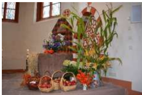
Die zum Erntedankfest geschmückte Rüdigheimer Kirche